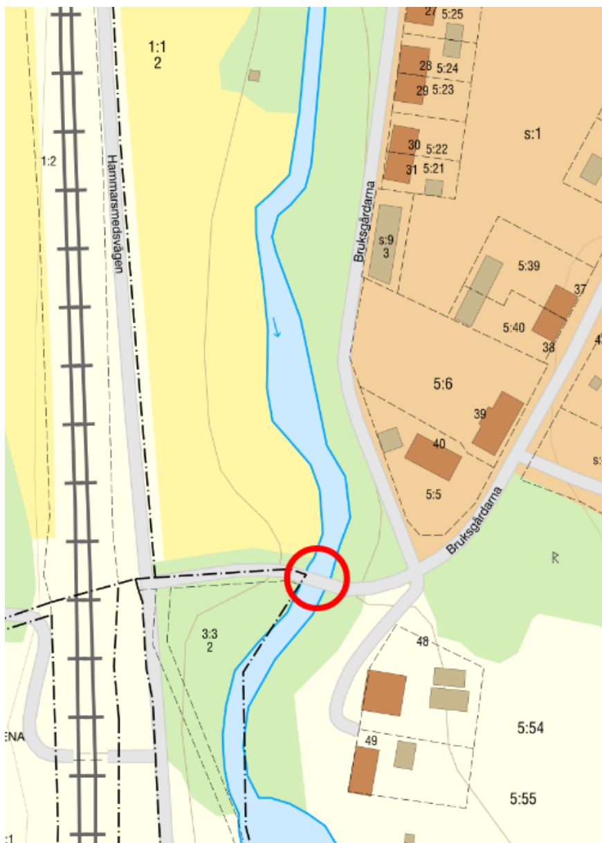
Figur 1: Kartbild från Lantmäteriets karttjänst med aktuell bro inom den röda ringen.

Uppdraget omfattar utredning av ansvarsfrågan avseende en stenbro på fastigheten Uppsala Vattholma 5:20, se figur 1 . Detta uppdrag ska klargöra vem som bör ansvara för brokonstruktionen.